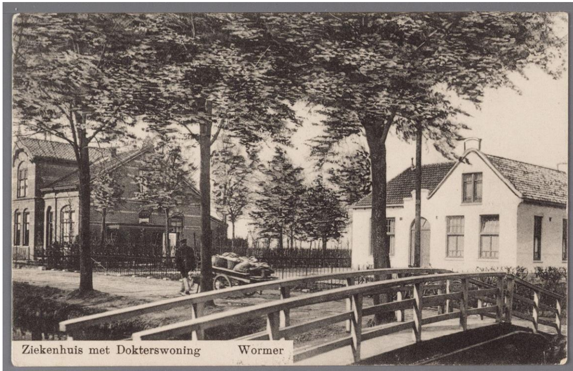
Links de dokterswoning met het afdakje voor wachtende patiënten. Rechts het ziekenhuis dat in 1912 werd gebouwd. WAT002001261