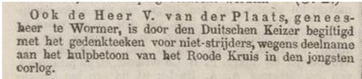
Het Nieuws van den dag: kleine courant 16-10-1873