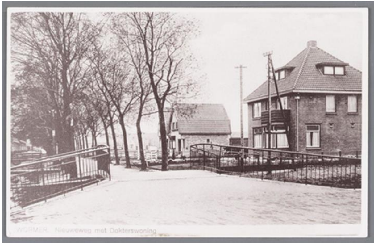
WAT002000110 Foto 1929, het perceel Nieuweweg 4 is nog niet gebouwd. De brug over de wegsloot naar 't Laantje zoals de Nieuweweg toen nog genoemd werd, met aan beide zijden een bomenrij en een wegsloot..