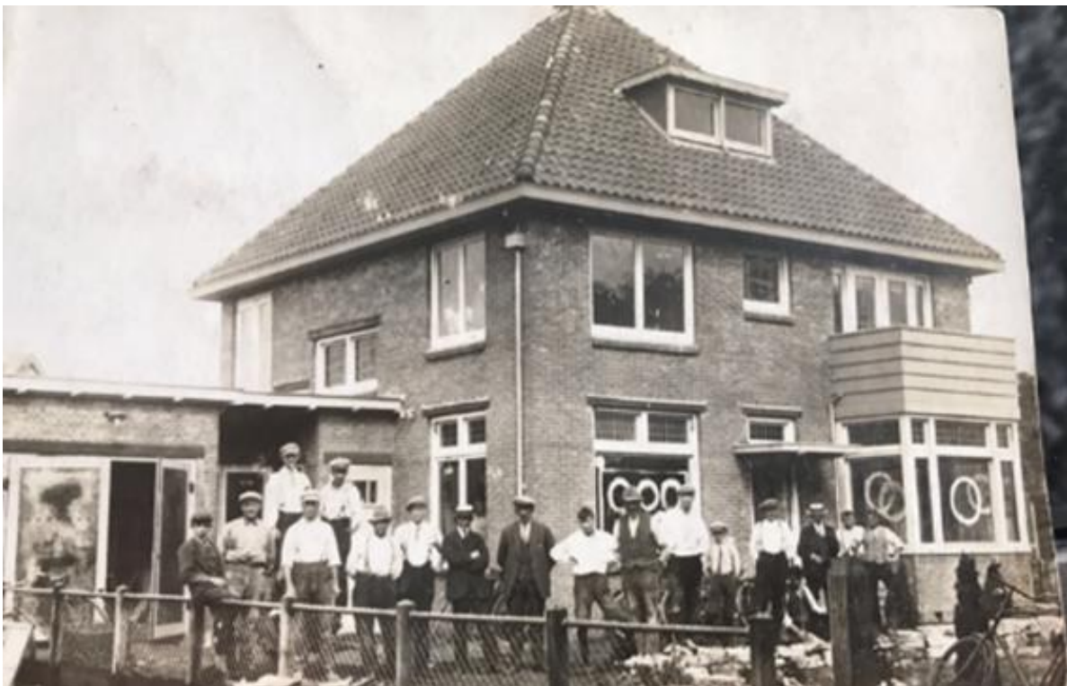
De ploeg bouwvakkers bij de oplevering van het huis.

Reeds op 29 december 1927 kocht hij het perceel, een stuk weiland, aan op de kruising van de Nieuweweg en de Zandweg. Op 21 januari werd een nieuwe akte opgesteld met een nauwkeuriger