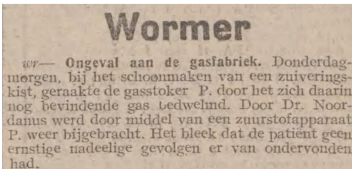
Ongeval zaterdag 11 december 1926. Men beschikte toen al over een zuurstofapparaat. De Zaanlander, 1926-12-11

Eveneens in november 1927 werden de resultaten gepubliceerd van een onderzoek bij 1100 kinderen in Zaandam waarbij gebleken was dat zeven procent door malaria-besmetting een vergrote milt had. Omgerekend betekende dit dat twintig procent van de bevolking besmet was. 22