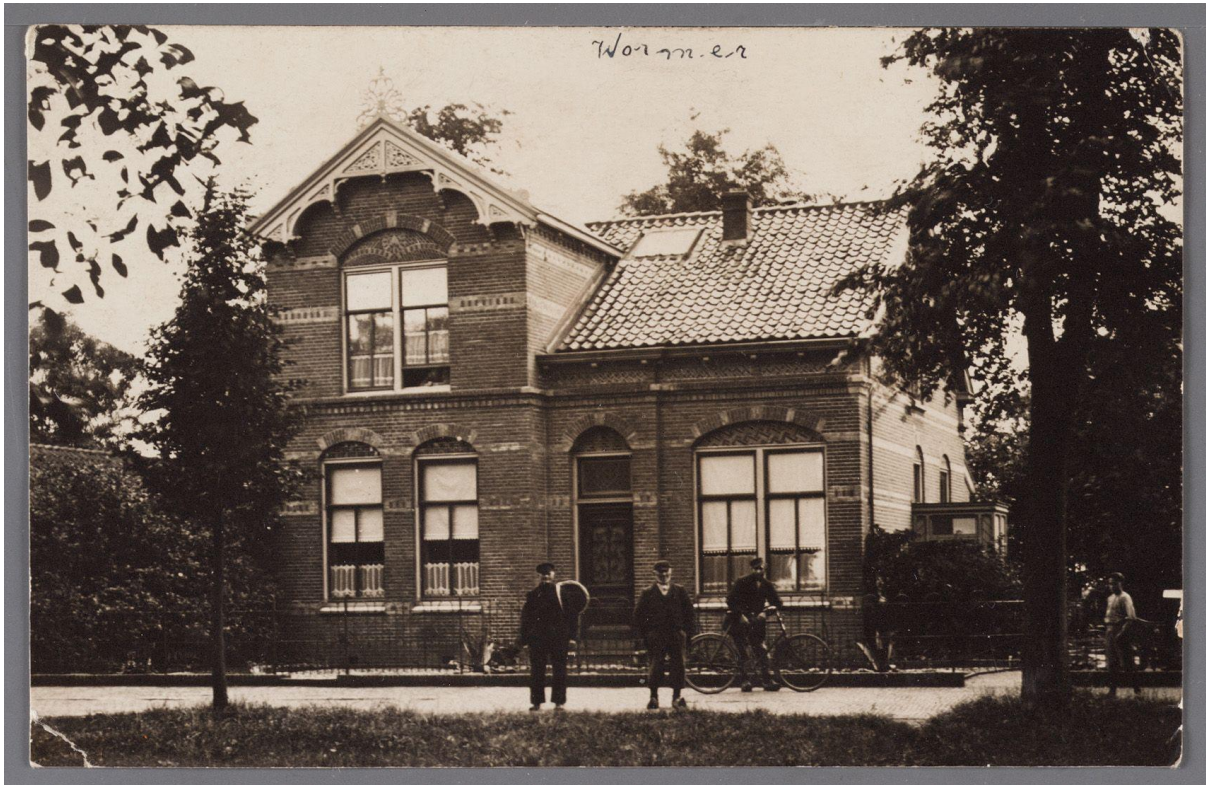
Het doktershuis voor 1915. WAT002001257

aantal weken waarop een zieke een uitkering zou ontvangen terug te brengen van 13 naar 10 weken. De wekelijkse uitkering bleef voorlopig vastgesteld op fl. 5,-. Er was nog fl. 1389,29 in kas. Zo nodig zouden in de toekomst de uitkeringen verder moeten worden verlaagd. 15